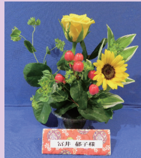
富井 郁子様 静岡中央