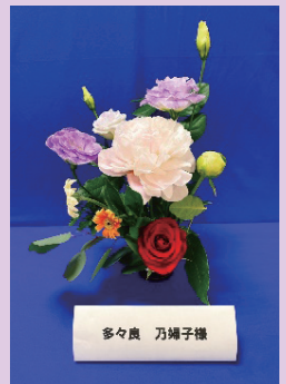
多々良 乃婦子様 押切