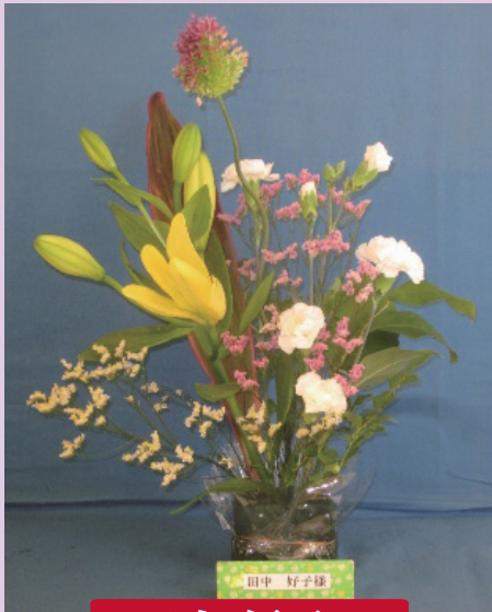
田中 好子様 清水銀座