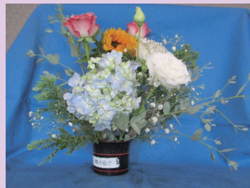
酒井 治子様 PHL小鹿公園前